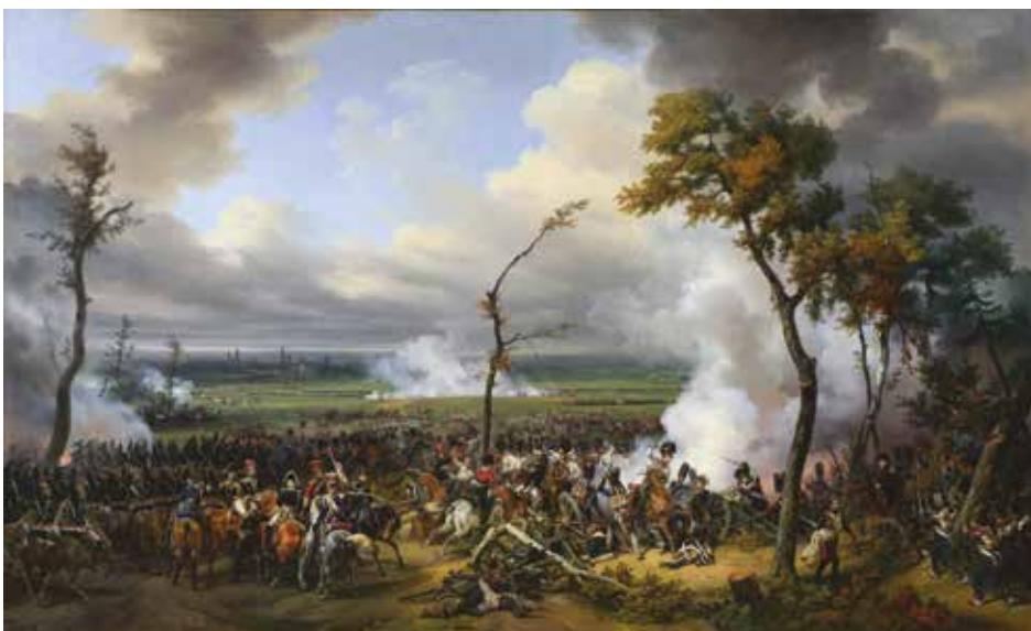
La Bataille de Hanau d'Horace Vernet (1789-1863)

Larrey comptait peu sur le succès de ses opérations, vu l'état de faiblesse où était cet