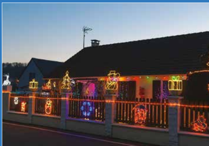
Lumineux le concours de décoration de Noël !