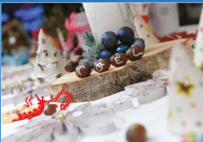
Encore un gros succès du Marché de Noël de l'IME ! Le Conservatoire de Dieppe était présent pour l'occasion pour apporter une touche musicale malgré le froid.