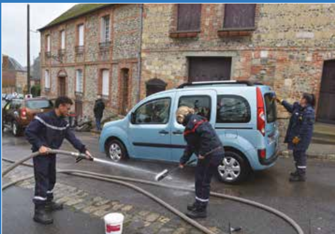
Samedi 8 décembre, les JSP ont nettoyé 89 véhicules et réalisé plus de 600 crêpes. Ils ont récolté 818,65 € au profit du Téléthon.