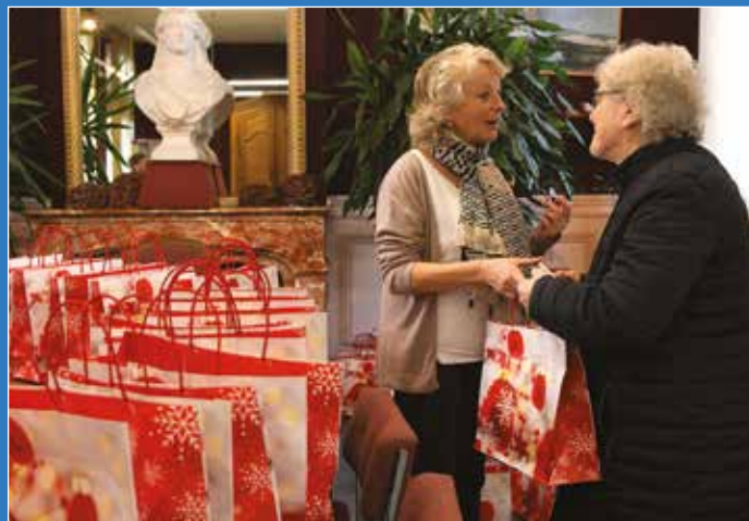
Fleurs, petites douceurs, comme chaque année la commune offre des colis à tous les aînés pour les fêtes de Noël.