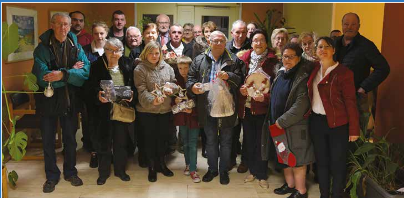
Financés par l'Atelier 880 et l'Amepa, les 26 participants du concours des décorations de Noël ont tous reçu des lots pour leur implication à mettre notre commune en lumière