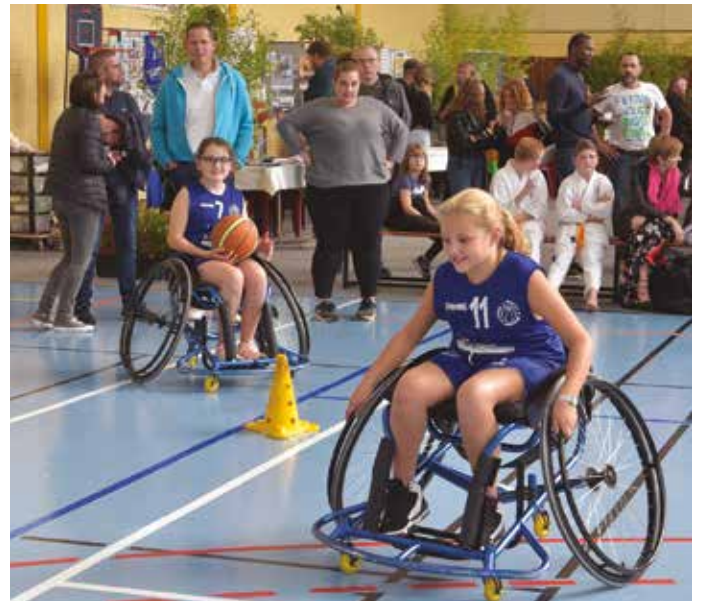
Basket, rugby, hand , les rencontres se sont enchaînées dans la bonne humeur.