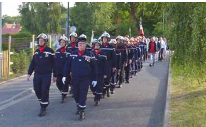
Au rythme de la batterie-fanfare, élus, riverains et pompiers ont rejoint les différentes stèles et l'église Notre-Dame pour un moment de recueillement.