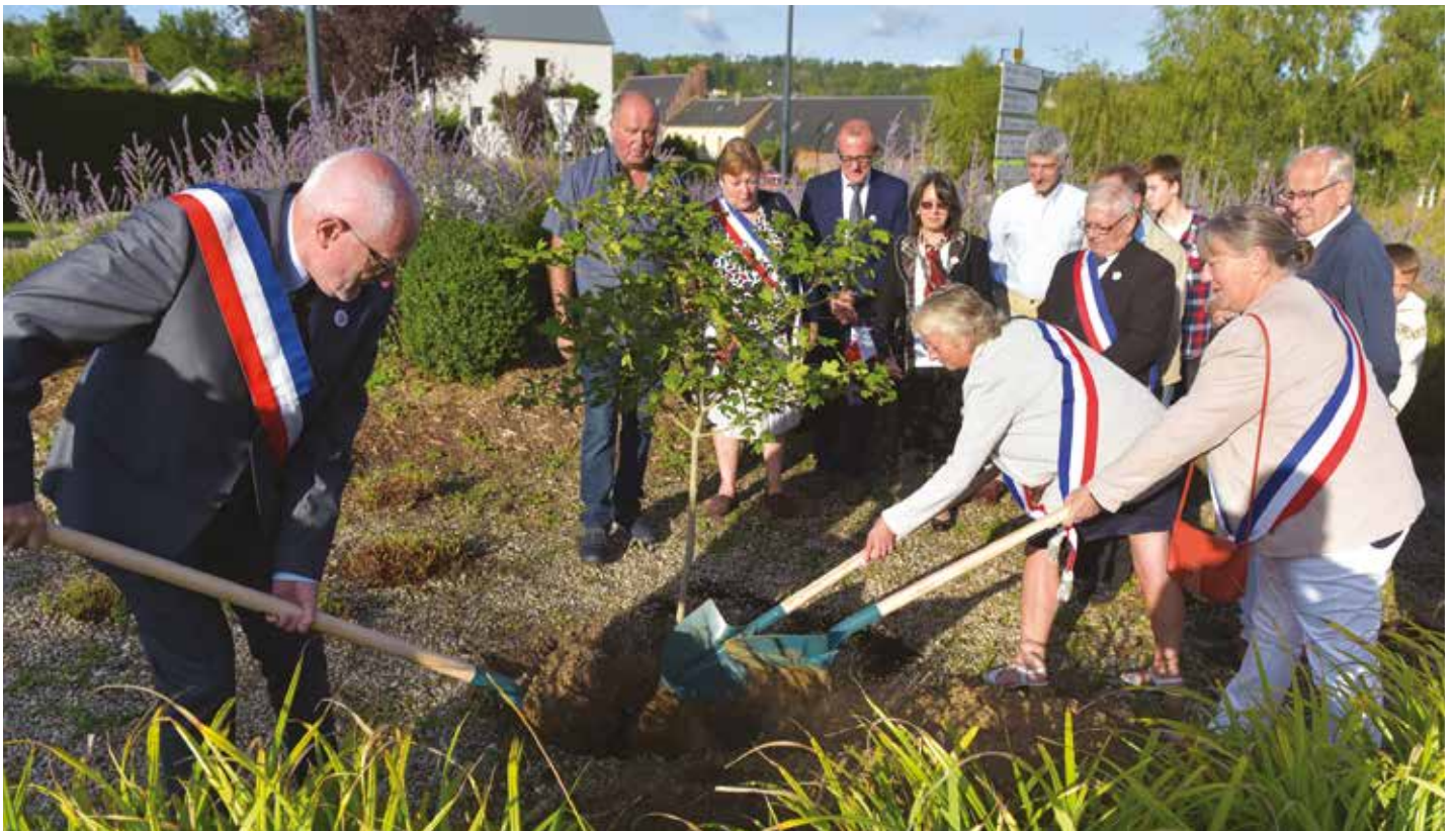
Pour que les jeunes générations se souviennent, un Arbre de la Liberté a été planté au carrefour d'Archelles . Une symbole forte, pour que l'histoire ne bégaye pas.