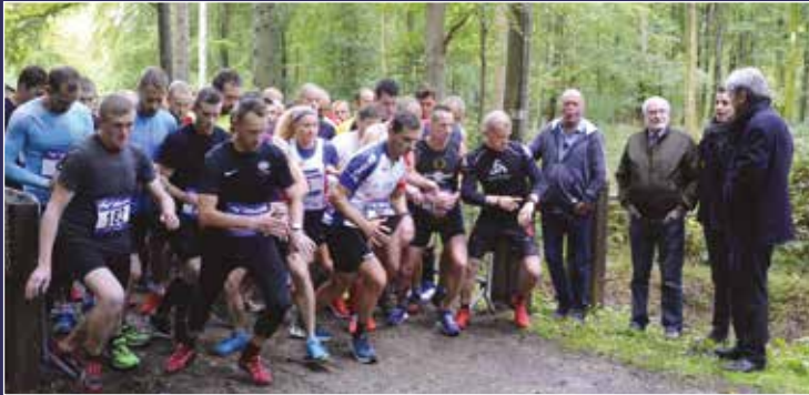
Départ donné par les maires de Dieppe et Arques-la-Bataille, en présence de Sébastien Jumel député, aux 150 participants pour le 21e cross des képis !