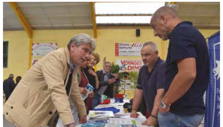
Sébastien Jumel, député, rapporteur sur l'inclusion des élèves handicapés dans l'école et l'université de la République pour l'Assemblée nationale est venu apporter son soutien à la manifestation.