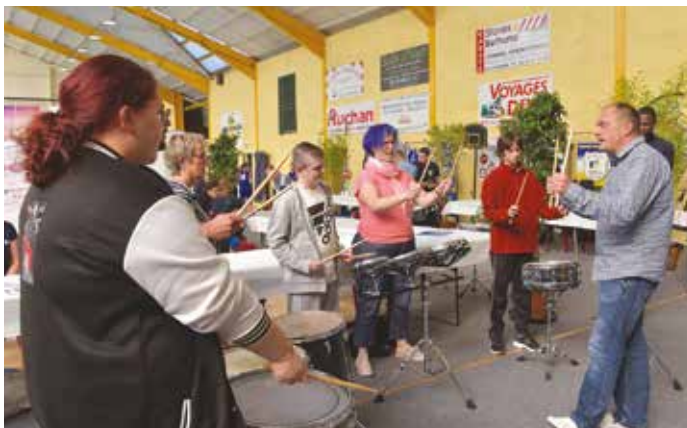
Le Conservatoire de Dieppe, accompagné de ses élèves de l'IME est venu présenter son travail de percussions.