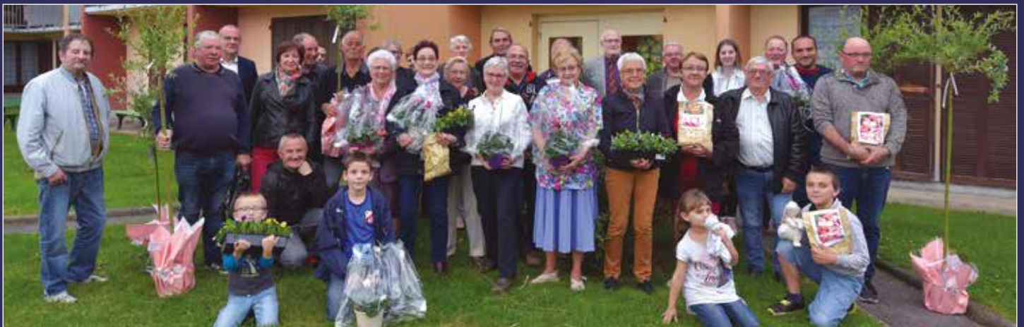
Samedi 5 octobre, les 31 participants du concours des balcons, maisons fleuries et jardins potagers ont été conviés par l'association Amitié et Partage pour la remise des prix. Toutes les mains vertes ont reçu de quoi semer et planter pour la saison prochaine. Manifestation avant tout conviviale, ce concours participe à l'embellissement de notre commune et de son cadre de vie.