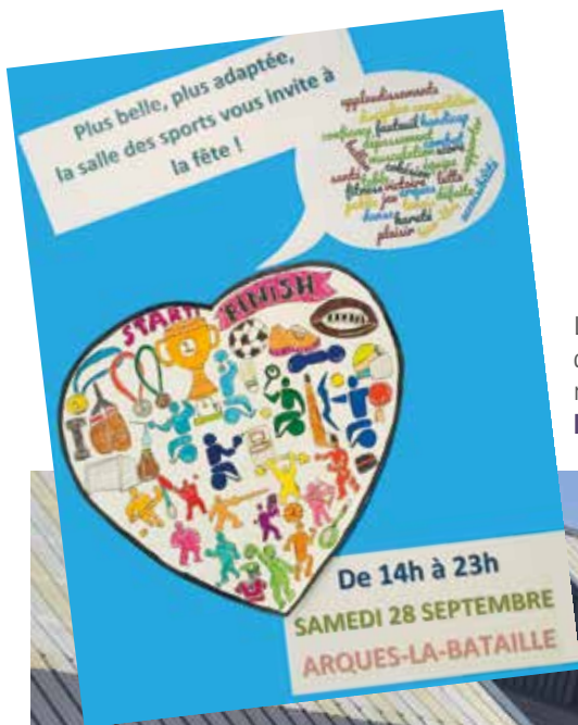
L'affiche et le graphisme de la manifestation ont été réalisés par les enfants de l'IME Château Blanc.

Une fête qui a fédéré les différentes associations arquaises et les intervenants dans le milieu du handicap, qu'ils soient professionnels ou bénévoles. Les agents municipaux ont été très sollicités pour le bon déroulement de cette journée, les services techniques pour la préparation et le montage des barnums mais aussi Jérémy Loiseau, Romain et Guillaume Lebourg qui ont redoublé d'énergie pour peindre les vestiaires, les charpentes extérieures, les toilettes et les fenêtres.