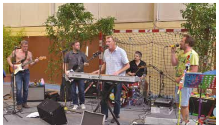
La soirée s'est terminée par le concert offert par le groupe « Corléones » et ses nombreuses reprises au son pop-rock.