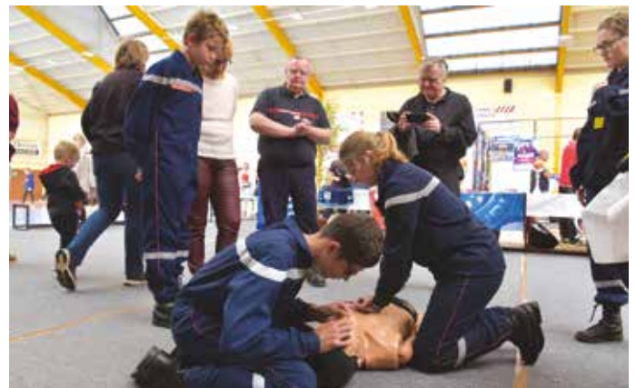
Exercices à la lance à incendie ou techniques de premiers secours, les JSP ont démontré leur savoir-faire.