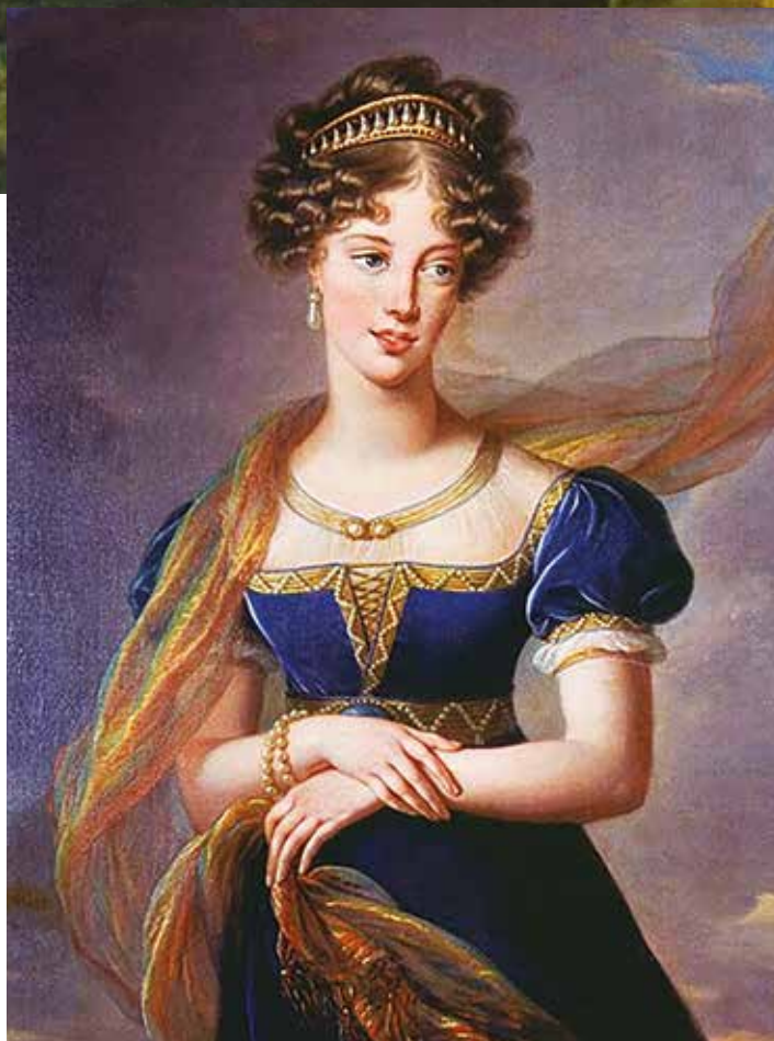
Marie-Caroline de Bourbon-Siciles, Duchesse de Berry en robe de velours bleu (1798-1870). Louise-Elisabeth Vigée-Lebrun