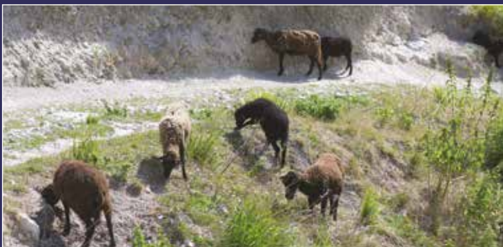
Comme chaque année, les moutons nettoient les abords du château mais ils sont facilement effrayés par les chiens non tenus en laisse. L'attention est recommandée aux maîtres pour éviter des chutes aux ovins.