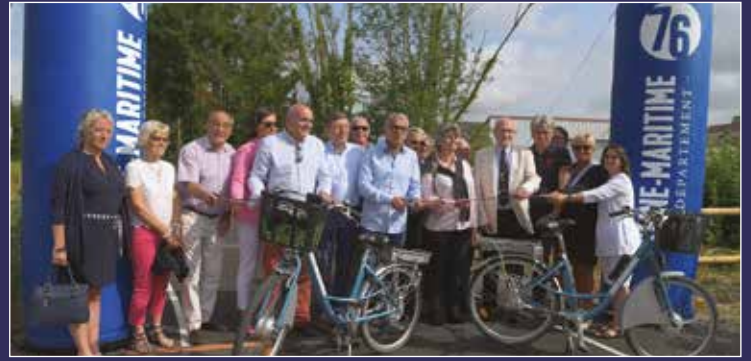
13 juillet, le tronçon reliant Arques à Dieppe a enfin été inauguré. Une attente récompensée pour tous les adeptes de la promenade en développement doux et en famille. Pour les plus sportifs, Paris n'est qu'à 250 km par les voies vertes !