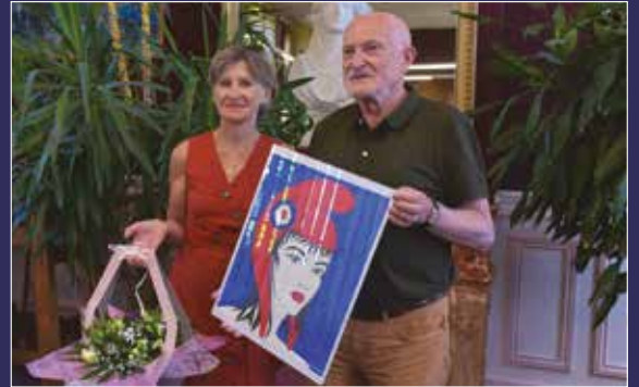
C'est l'artiste Véronique De Koninck qui a réalisé la Marianne pour les festivités du 14 juillet.