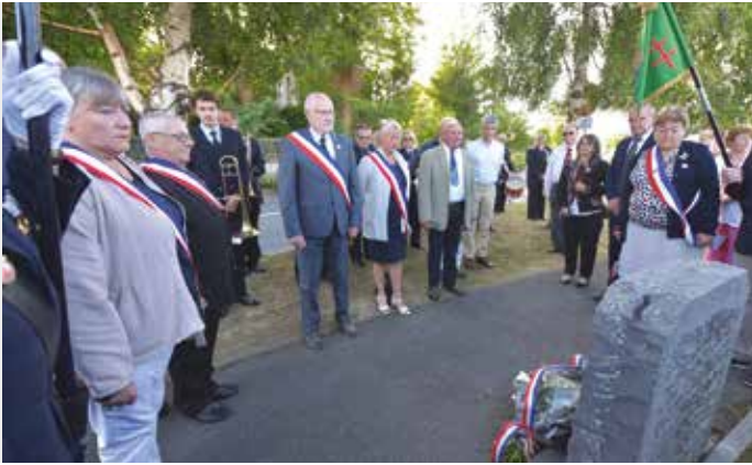
Un hommage a été rendu aux victimes de la barbarie nazie, à la stèle des fusillés d' Hesmond , rue Verdier-Monetti et au Monument du souvenir et de la paix .