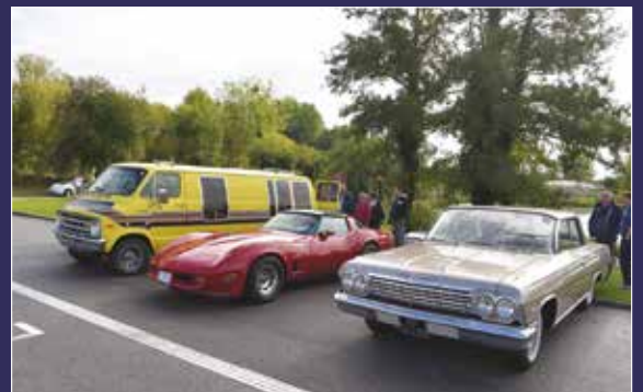
L'association German Family's a organisé son 1 er rassemblement de voitures allemandes et américaines. Un événement qui pourrait se transformer en rendez-vous annuel.