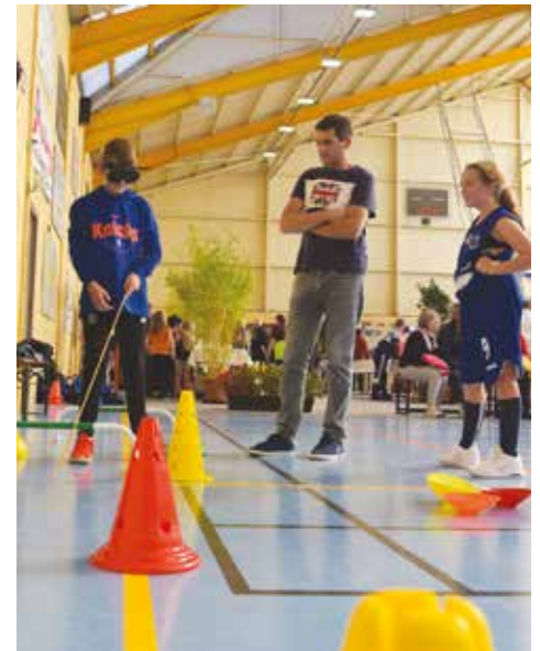
Pour se rendre compte de la difficulté de se déplacer quand il vous manque la vue, Sport et handicap a mis en place un parcours de cécité.