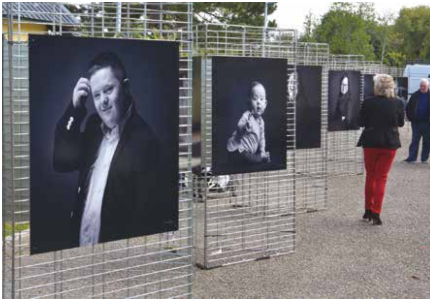
« Changeons de regard ». La magnifique exposition photo du portraitiste Emmanuel Grancher sur les personnes atteintes de Trisomie 21.