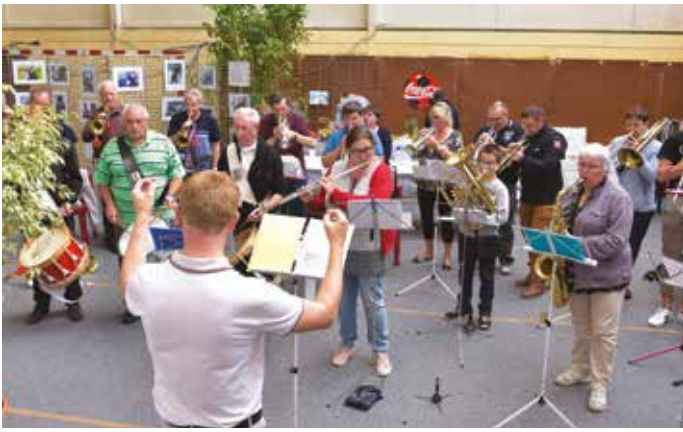
Dès la fin des discours, l'Entente Arques-Ancourt a envoyé les premières notes de cete manifestation.