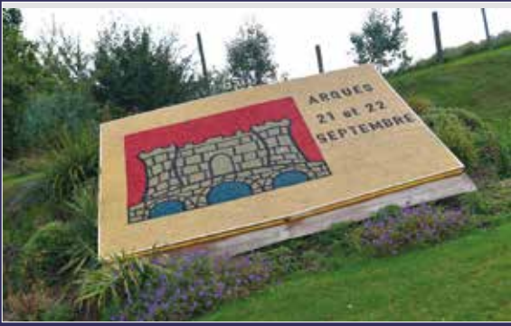
Un coup de chapeau à nos agents communaux qui réalisent des fresques monumentales au rond-point de la Maison rouge.