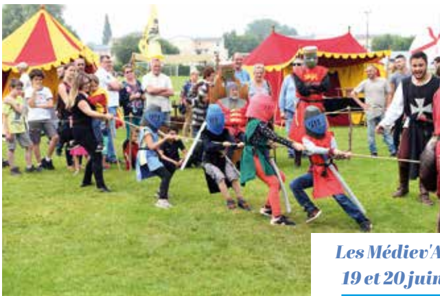
Les Médiév'Arques 19 et 20 juin 2021