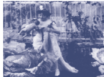
A 23 ans Alice Guy réalise son premier film La Fée aux choux

Née à Saint-Mandé en 1873, Alice Guy décède en 1968 sans avoir pu revoir ses films.