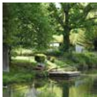
Page 4 Au fil de l'Arques