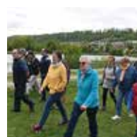
Page 12 Sports : Les parcours du cœur, Le canicross