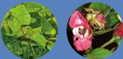
La Renouée du Japon et la Grande Balsamine

Venues d'Asie, elles prolifèrent allégrement sur nos talus et nos berges. Aussi jolies soient-elles, la croissance exponentielle de La Renouée du Japon et de la Grande Balsamine colonise et étouffe toutes les variétés. Elles ne sont pas sans conséquence pour la faune et l'habitat des insectes et des petits mammifères locaux. Herbacée très vigoureuse, la Renouée du Japon est d'ailleurs inscrite parmi les 100 espèces les plus préoccupantes. « Il n'y a aucune solution concrète pour en venir à bout » témoigne un technicien du SMBVA, « elle a un pouvoir de reproduction très fort par son bouturage aérien et ses rhizomes ».