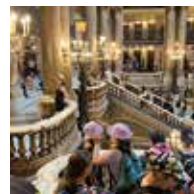
Page 5 Les enfants d'Arques à l'Opéra Garnier