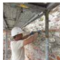
Page 8 La sauvegarde du château