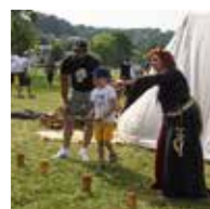
Page 16 Les Médièv Arques, acte VI, Cérémonie du 14 juillet