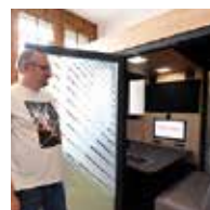
Page 6-7 Les arquais connectés, Concert de printemps le Chapiteau de DSN,