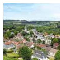
Page 9-10 Budget 2022, Vie économique