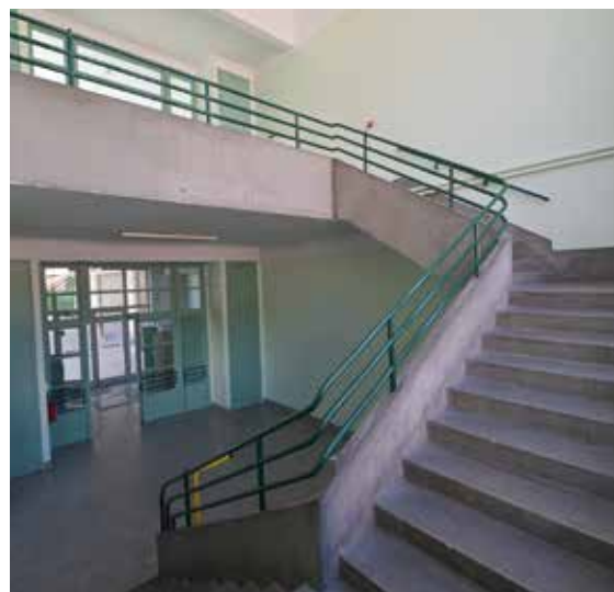
A l'école élémentaire Louis Germain, les murs et plafonds des quatre magnifiques cages d'escaliers ont fait peau neuve pour un coût de 27 900 € H.T.

Dès cette année, un City Park extérieur va être réalisé près du gymnase de l'Étoile.